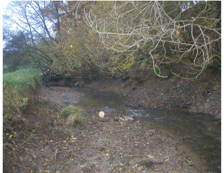
Nasse vidée qui se cure avec les crues

Cet automne 2004, Amikuzeko Erreken Lagunak a commencé le nettoyage de la Joyeuse au « Pont International », séparant les communes de Landibarre et d'Armendaritze. Ayant veillé à vider la chute de retenue d'eau, nous avons dégagé la nasse de ses principaux enchevêtrements d'arbres morts, permettant la libération de l'eau boueuse, mélange de feuilles mortes en putréfaction et de lisier déversé par les agriculteurs riverains.