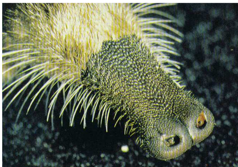
Sa trompe possède un nombre considérable de terminaisons nerveuses

Son allure déjà est singulière. Cousin de la taupe, il pèse entre cinquante et quatre-vingt grammes pour une douzaine de centimètre sans la queue. Il marche d'une manière étrange sur le bout d'énormes pieds palmés, l'arrière train en l'air, la tête dans les épaules précédée de deux centimètres d'une trompe obscure.