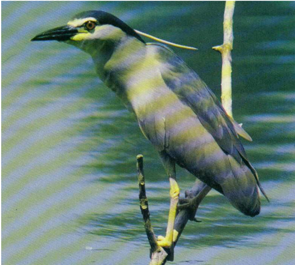
De la même famille que le héron cendré, le héron bihoreau

Depuis que le héron est protégé par la loi de 1976, ses effectifs ont nettement augmenté, à tel point qu'on commence à le voir sur les bords des rivières et pas seulement dans les marais ou sur les rives des étangs. Le pêcheur redoute la concurrence de cet oiseau aux réflexes fulgurants, armé d'un bec puissant, qui ne craint pas de s'attaquer à la belle truite.